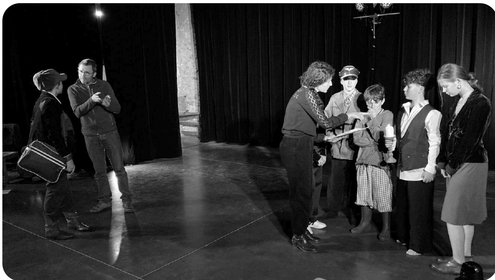
Photographie extraite du spectacle "Les Misérables", projet d'éducation artistique et culturelle conduit de 2024 à 2026 au collège de Latillé (86).